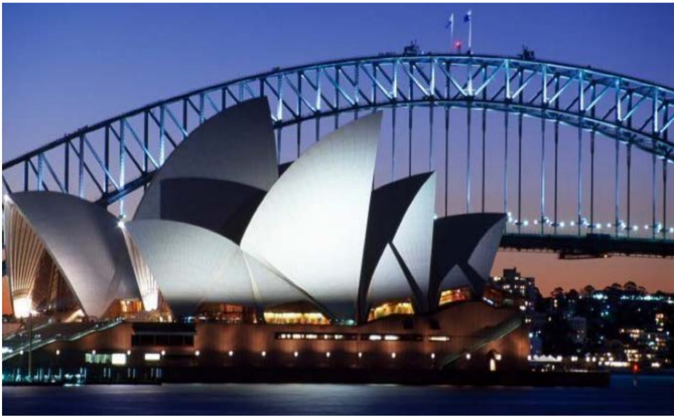
夜幕下的悉尼歌剧院唯美夺目 仿佛夜空下一颗璀璨的星

沿着环形码头漫步，寻找悉尼歌剧院永不褪色的秘密。丰富多样、日程紧凑的演出计划让歌剧院成为悉尼最繁忙的音乐、艺术和表演场馆之一，参加幕后之旅（Backstage Tour），了解歌剧院背后的工作机制，这类游览活动信息量丰富，且有包括日语、普通话和法语等多种语言讲解，为来自世界任何角落的你带来最深度最人性化的服务。