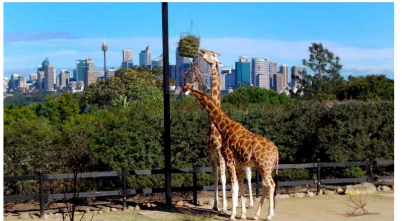
这座动物园里生活了2900多种外来及本土动物

从环形码头（Circular Quay）乘坐渡轮去动物朋友们居住的水滨家园——塔龙加动物园看望它们，这座动物园里生活了2900多种外来及本土动物，包括大猩猩、老虎、豹子、黑猩猩、长颈鹿、袋鼠和考拉，想要住宿的童鞋，请预订 Roar & Snore 旅游套餐，更有多种奇幻灯光秀等你来体验，在动物园里度过一个不一样的夜晚，尽在塔龙加。